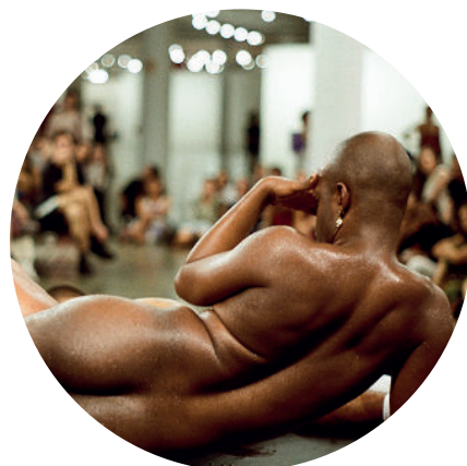
@ Fa Avilla