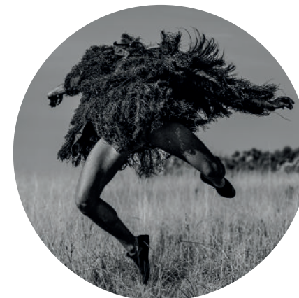
@ Andrzej Grabowski