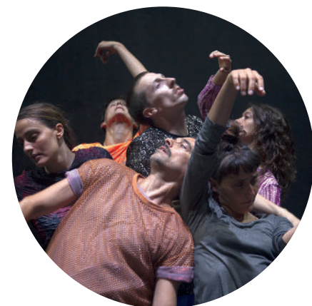
@ Franco Mento

La compagnie propose une initiation à la chorale avant les représentations. Rendez-vous p.47 !