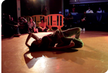
FILM + RENCONTRE

➤ MÉDIATHÈQUE DE BAGNOLET 1 RUE MARCEAU 93170 BAGNOLET JEU 03/04 19:00 GRATUIT