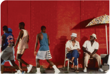
FILM + DÉMO

➤ LA CGT 263 RUE DE PARIS 93100 MONTREUIL DIM 06/04 14:00 GRATUIT